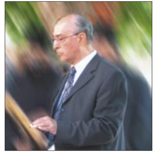
Του Λάμπρου Πασιαλή

Ο Περικλῆς είχε εκφωνήσει τον περίφημο αυτό επικήδειο στον